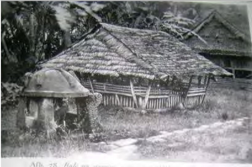
Abb. 28. Bahi on aumoo...