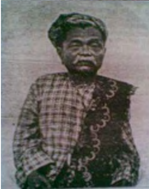
FOTO KAUM BANGSAWAN PADA ZAMAN DAHULU